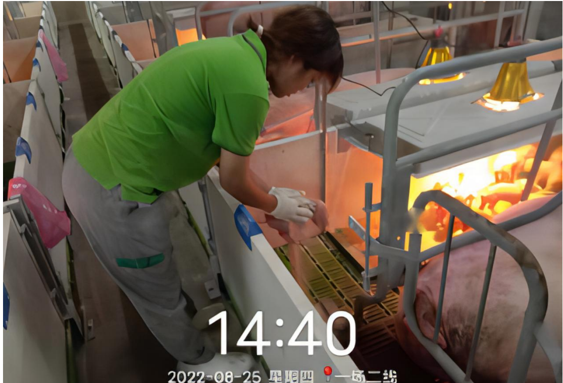
图6 专业学生在真实岗位开展学习