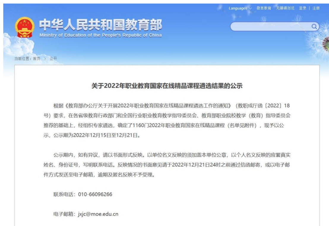
图4 国家在线精品课程遴选结果公示