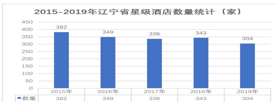
图 5 2015-2019 年辽宁省星级酒店数量统计

济型酒店发展，积极引导规范家庭旅馆、乡村旅馆、汽车旅馆等发展，以适应大众化旅游发展的需要。按此计划，全省仅各类旅游住宿设施每年就要增加 600 家，星级酒店每年则需要增加 40 家。按全国星级酒店的平均客房 120 间计算，则每年新增加客房数约为 4800 间。辽宁省每年新增星级酒店所需工作人员就在 200-12000 人之间。其余 560 家新增住宿设施以每家 10 名工作人员保守估计，则需要 5600 左右。因此辽宁省仅每年增加的各类旅游住宿设施一项就需要各类工作人员在 12800-17600 人之间。而省内开设酒店管理、旅游管理及相关专业的高等院校 30 所左右，每年毕业生近 3700 人，存在巨大需求缺口。