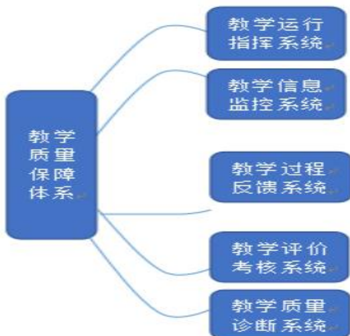
图 3 质量保障体系构成图