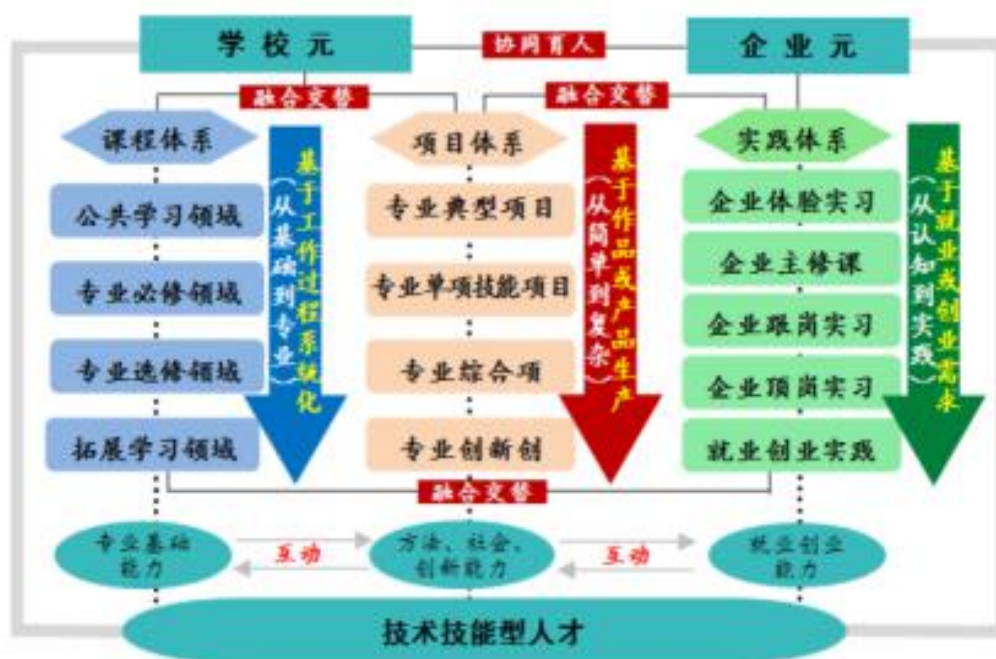
图4 “二元双体系”架构图